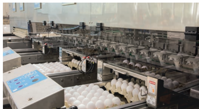
Dropbox (Novum 55)