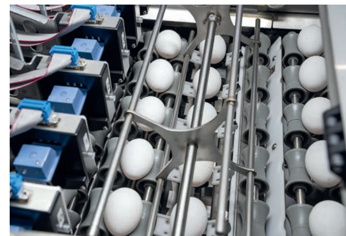
Tojás címkézés (E-Grader)

A tojáscímkézési technológia területén szerzett sokéves tapasztalatunknak köszönhetően a Novum és az E-Grader sorozat lehetőséget kínál arra, hogy minden egyes tojást saját szöveggel nyomtassanak. Ezért a felhasználók gyorsan és pontosan dolgozhatják fel a különböző tételeket. A nyomtatás történhet például VÖLKER tojáscímkével, tintapatronokkal. A tinták és tintapatronok folyamatos továbbfejlesztése révén ez a nyomtatás lenyűgöző a könnyű kezelhetősége, a magas variálhatósága és a alacsony működési költségei miatt. Felmelegedési idő és egyéni tisztítások és rendszeres karbantartások nem szükségesek.