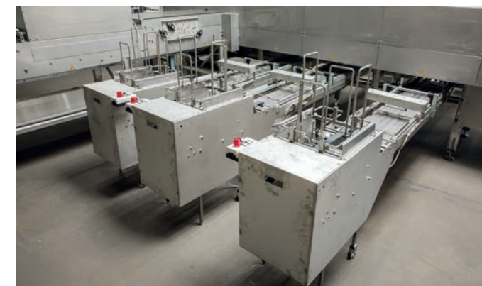
De-nester (azonos felépítés minden gép esetében)