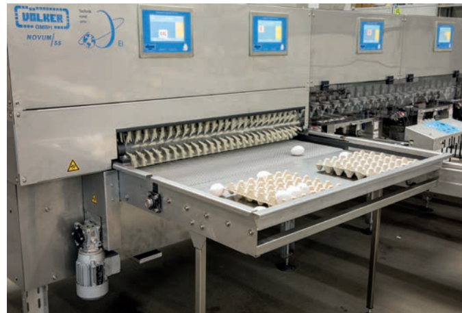
Kézi csomagolóasztal (Novum 55)